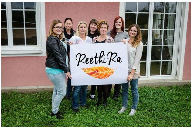
Reethi Ra in Stainz eine sichere Insel für junge Frauen

Die Burg Deutschlandsberg wird daher auf Initiative des Soroptimist International Clubs Deutschlandsberg und des Burgmuseums Archeo Norico ab 25. November in orangem Licht erstrahlen. Das Theaterzentrum Deutschlandsberg und das Laßnitzhaus Deutschlandberg lassen ihren Eingangsbereich als Zeichen der Solidarität mit dieser Aktion ebenfalls orange leuchten. Auch das Landeskrankenhaus Weststeiermark, Standort Deutschlandsberg schließt sich, wie viele Krankenhäuser in der Steiermark, dieser Kampagne an.